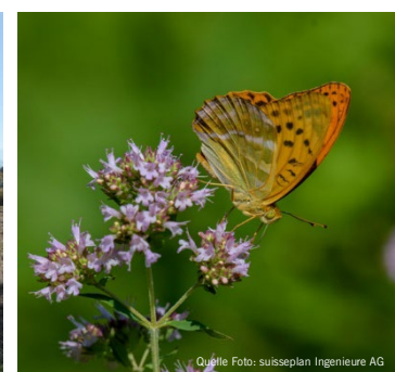
Kaisermantel beim Nektar trinken