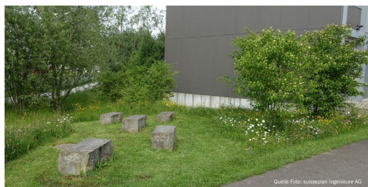
Rückzugsstreifen als Teil der Gestaltung

Bei Flächen, die von Problempflanzen bzw. invasiven Neophyten befallen sind, darf kein Rückzugsstreifen stehen gelassen werden. Dieser wäre bei der Bekämpfung von unerwünschten Pflanzen wie Goldruten, Adlerfarn oder Landschilf kontraproduktiv. Ebenso sollte bei Flächen, die mit Verbuschung zu kämpfen haben, auf einen Rückzugsstreifen verzichtet werden.