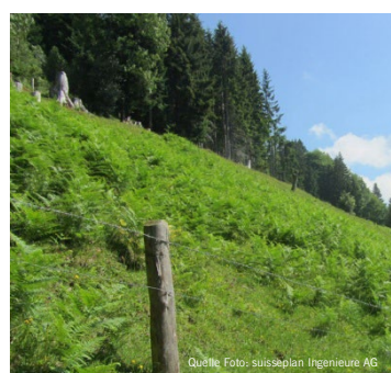
Adlerfarn ( Pteridium aquilinum )

Das Amt für Wald und Natur und suisseplan suchen gemeinsam den attraktivsten Rückzugsstreifen im Jahr 2026. Haben Sie einen fantasievoll gestalteten und besonders schönen Rückzugsstreifen angelegt oder kennen einen solchen Streifen im Kanton Schwyz?