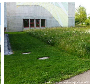
Rückzugsstreifen im Siedlungsraum