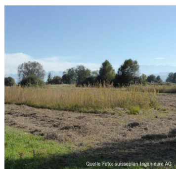
Frisch gemähte Streuefläche

Rückzugsstreifen sind wertvolle Trittsteine in der Kulturlandschaft, aber auch im Siedlungsraum. Ungemähte Flächen wirken wie grüne Brücken. Sie vernetzen die Lebensräume von Kleintieren und Insekten, damit diese sicher wandern und sich fortpflanzen können. So bleibt die Vielfalt im Kanton Schwyz erhalten.