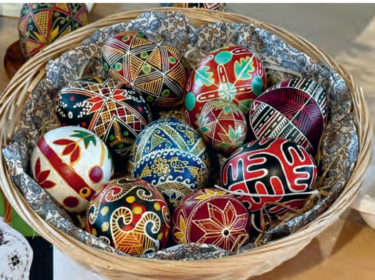
Pysanka: Kunstvoll verzierte Eier mit viel Symbolkraft - ein ukrainisches Kulturgut.

dem Motto «Musik schafft Gemeinschaft». Zahlreiche Gruppierungen aus verschiedenen Ländern präsentierten ein buntes Programm mit Tanz, Gesang, kulinarischen Spezialitäten sowie Kunsthandwerk, ergänzt durch Workshops und Ausstellungen. Mit dem Anlass wurde der transkulturelle Austausch gefördert und Begegnungen zwischen der einheimischen Bevölkerung und den zugezogenen Personen mit Migrationserfahrungen ermöglicht. Rund 400 Besucherinnen und Besucher freuten sich über die vielfältigen Darbietungen und die lockere Atmosphäre beim Fest der kulturellen Vielfalt.