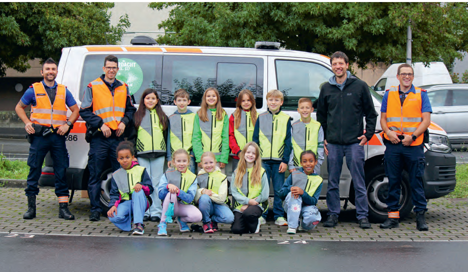
Team Kids and Cops.