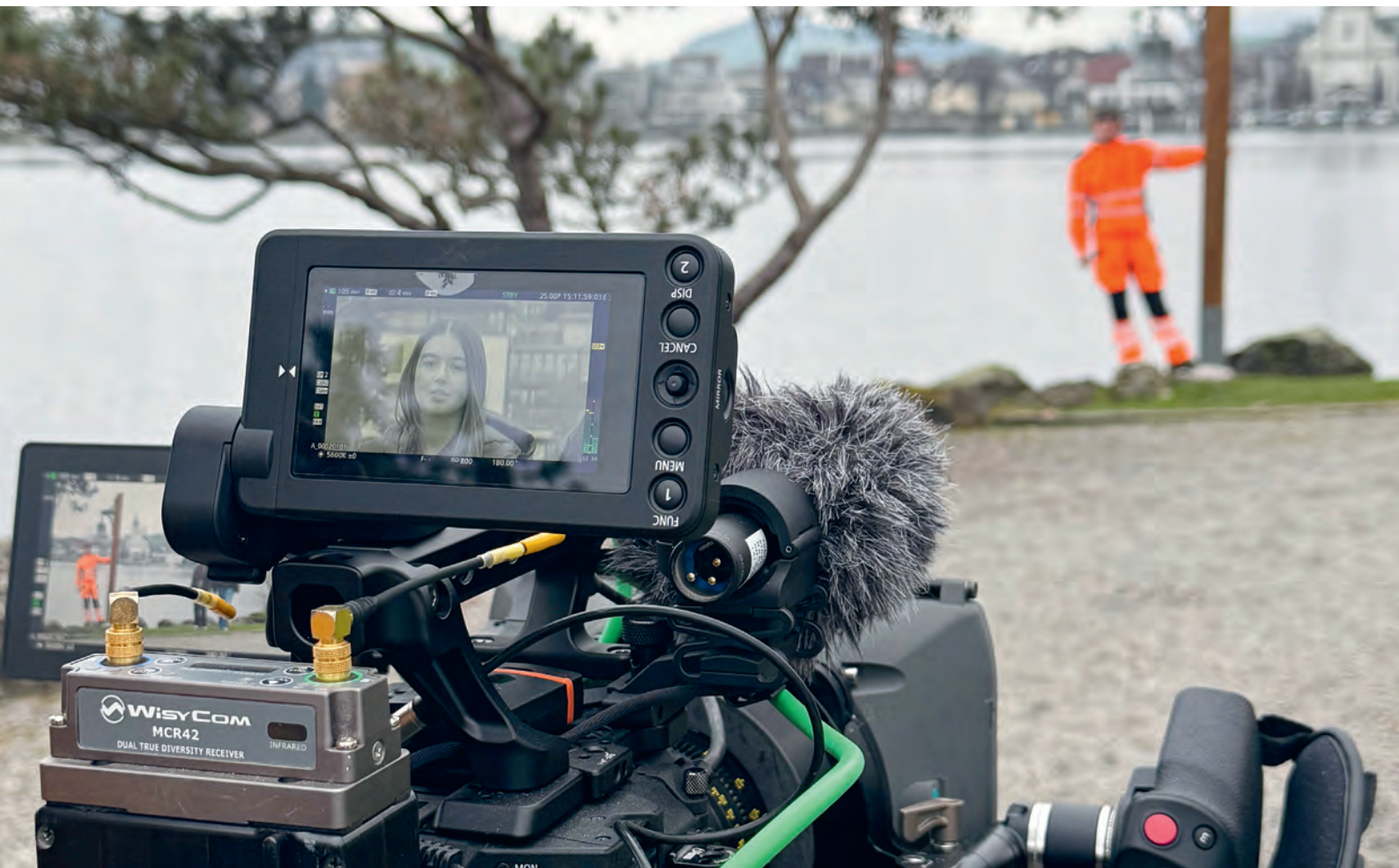
Dreharbeiten für Werbefilm Lehrstellen des Bezirks Küssnacht.