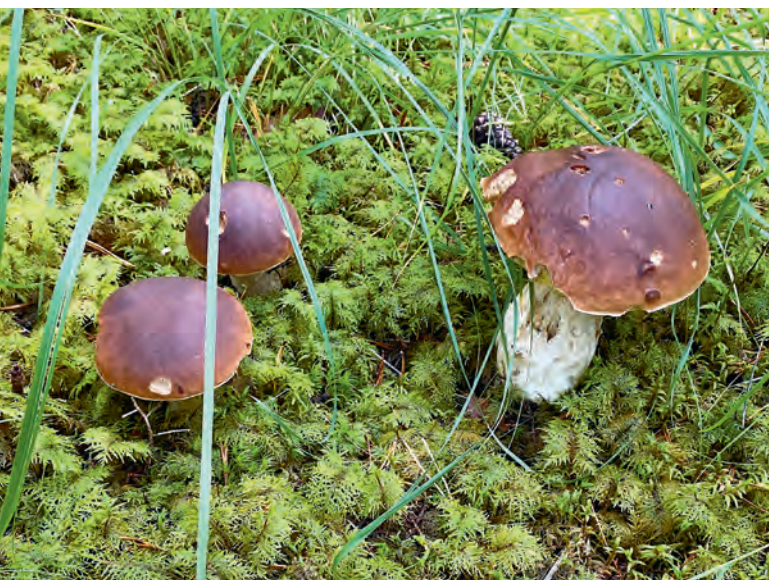
Fichten-Steinpilze; Boletus edulis , Bull. Fr.

(Beträge sind auf ganze Franken gerundet)