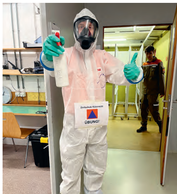
Ein Führungsunterstützer im ABC-Schutz. Eine neu gewonnene Kompetenz.

Laufende Pendenzen, wie organisatorische, personelle und administrative Aufgaben zur Sicherstellung des Betriebs und der Funktionsfähigkeit der Organisation, wurden in fünf über das Jahr verteilten Sitzungen durch die Zivilschutzleitung Küssnacht behandelt und erfolgreich bearbeitet.