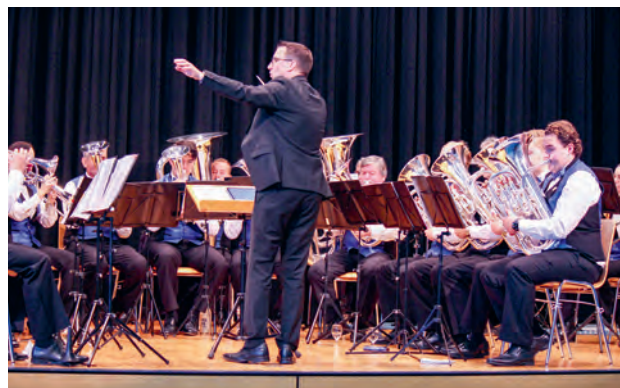
Musikgesellschaft Immensee - Auftritt am Neujahrsapéro.

Der beliebte Neujahrs-Apéro, der turnusgemäss am 5. Januar 2025 in Immensee stattfand, markierte auch dieses Jahr den gemeinsamen Start ins neue Jahr. Ungefähr 500 Personen aus dem Bezirk wurden herzlich begrüsst. Die Teilnehmenden genossen das gesellige Beisammensein, den regen Austausch und die fröhliche Atmosphäre, die von der Musik der Musikgesellschaft Immensee untermalt wurde.