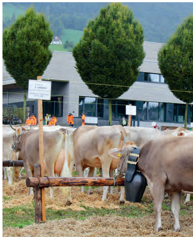
Viehausstellung auf der Wiese unterhalb des Werkhofs.