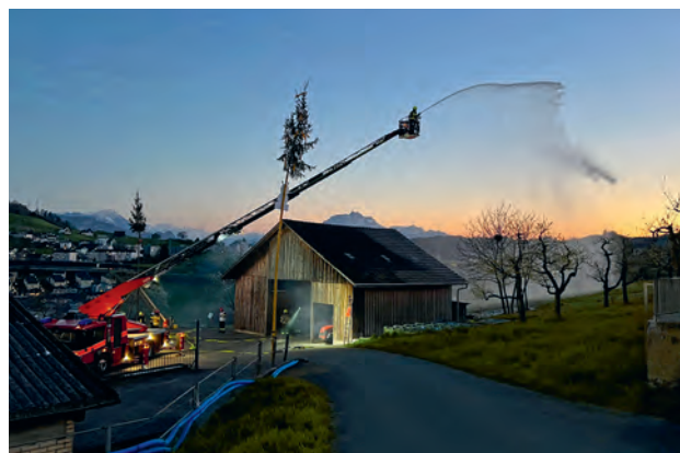
Die Stützpunkt Feuerwehr Küssnacht anlässlich einer Gesamtübung im April 2025.

Die siebenköpfige Feuerwehrkommission unter dem Präsidium von Bezirksammann Oliver Ebert hielt im vergangenen Jahr wiederum drei Sitzungen ab. Die Kommission behandelte wie gewohnt diverse strategische Themen. Schwerpunktmässig befasste man sich