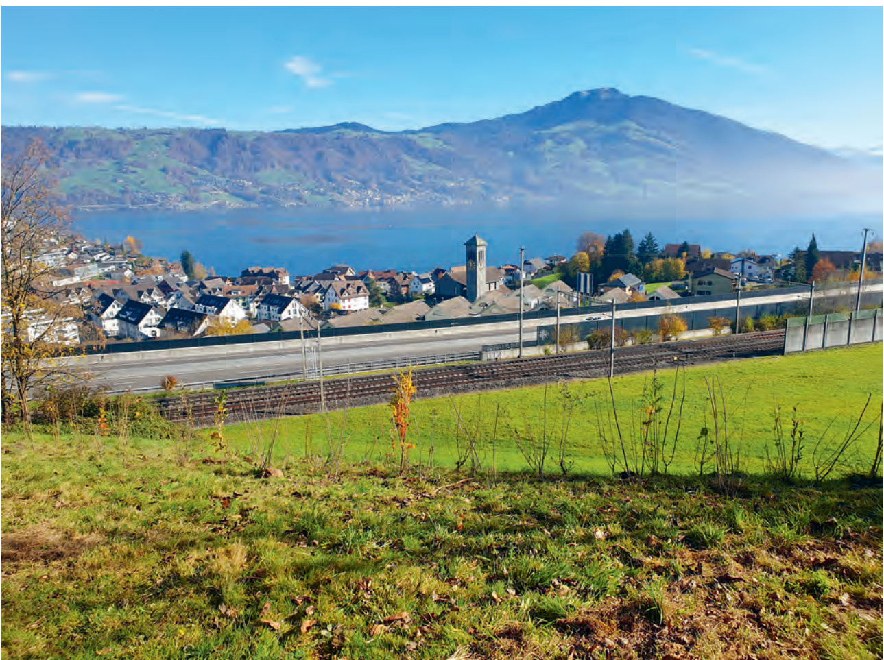
Neu gepflanzte Hecke in Immensee.

Im Gartenjahr 2026 sind eine Infoveranstaltung für Gartenbesitzer, Gartenberatungen, ein Gartenwettbewerb sowie kostenlose Abgaben von einheimischen Sträuchern, Stauden und Samenmischungen geplant. Ausserdem werden weitere Aufwertungsmaßnahmen auf bezirkseigenen Flächen im Siedlungsgebiet und im Wald umgesetzt. Auch in diesem Jahr wird es einen öffentlichen Spaziergang zur Einweihung des neuen Panorama-Rundwegs geben. Im Rahmen des Amphibienprojekts werden ausserdem an mehreren Standorten Amphibienweiher gebaut.