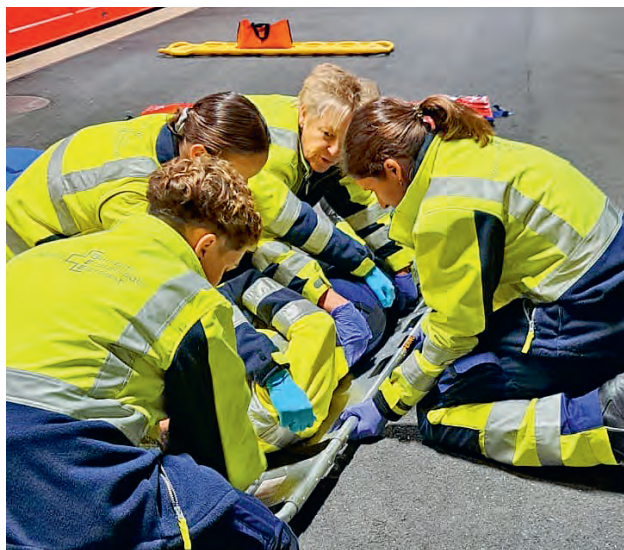
Das Team des SEE übt sich beim Lagern einer verletzten Person in der Schaufeltrage.

Zum Jahresbeginn fand die traditionelle «Kropflärete» und Materialkontrolle statt, bei der das gesamte Material systematisch kontrolliert wurde. Diese Veranstaltung diente nicht nur der Qualitätssicherung der Ausrüstung, sondern bot auch einen wertvollen Rahmen für den gemeinsamen Austausch. Teammitglieder konnten Informationen weitergeben, Anregungen ein-