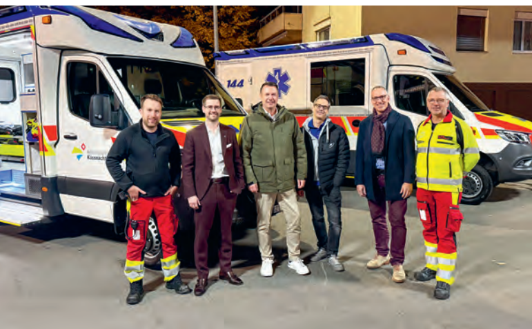
Einweihung zweiter Rettungswagen am 3. November 2025.