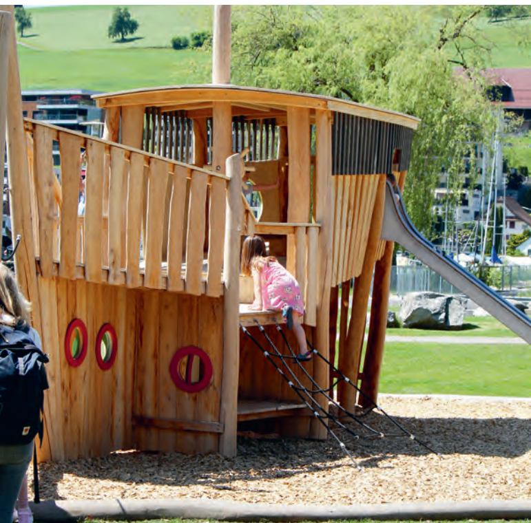
Spielplatz am Quai.

geben werden, sie wird seither von den Kindern und Jugendlichen mit grosser Freude und hoher Freqüenz gut genutzt.