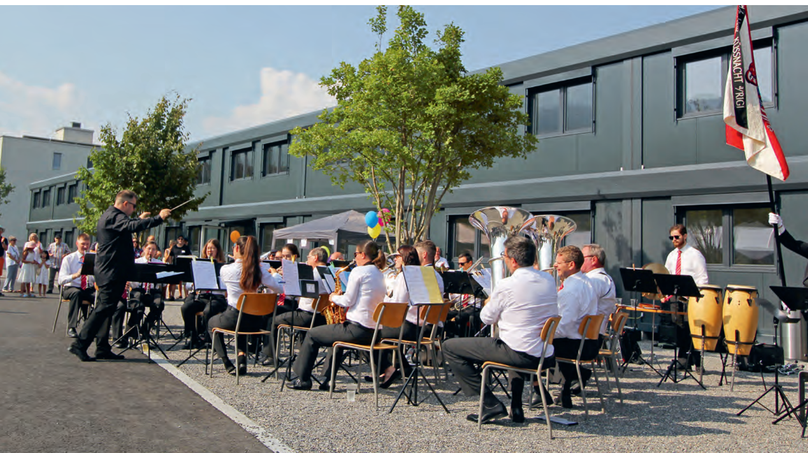
Eröffnungsfeier Schulprovisorium Chaspersmatte.