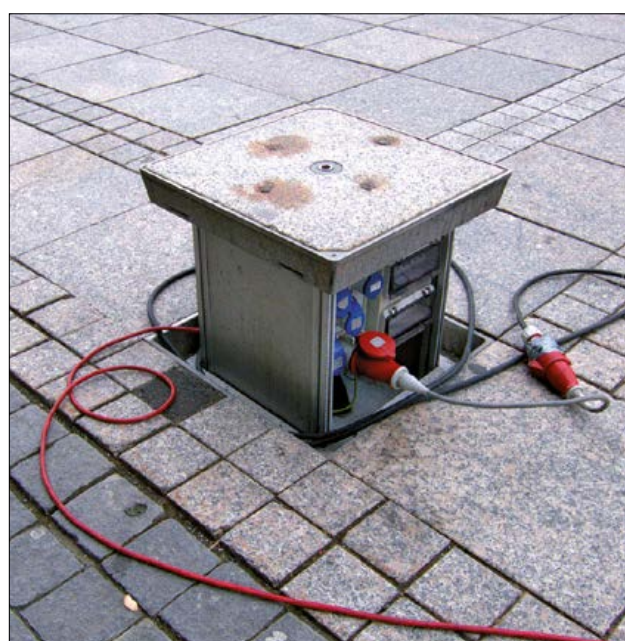
Senkelektant mit Strom- und Wasseranschluss.

Dann wenden Sie sich bitte an das Ressort Planung, Umwelt und Verkehr des Bezirks Küssnacht, Telefon 041 854 02 30, E-Mail bauamt@kuessnacht.ch