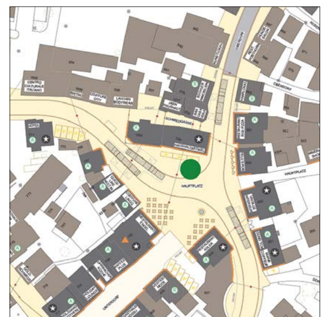
Gestaltung Hauptplatz mit Bushaltestellen.