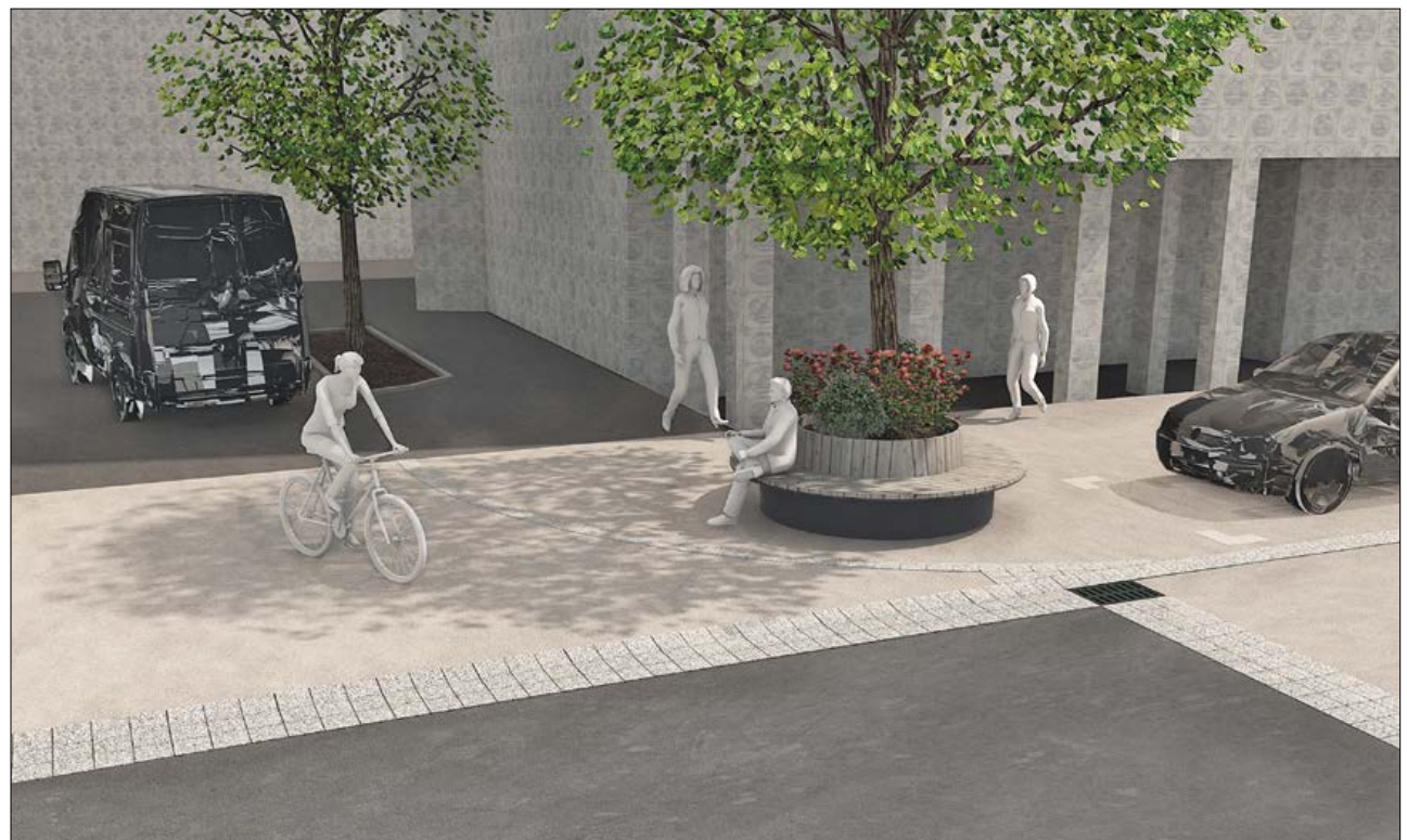
Bäume und runde Sitzbank bei der Einfahrt zum Coop.