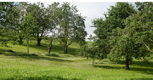
Hochstamm-Obstgärten bilden einen wichtigen Teil unserer traditionellen Kulturlandschaft.

Hochstamm-Obstgärten wurden traditionell zur Obstgewinnung angelegt. Sie charakterisieren die Landschaft und bieten vielen, teilweise bedrohten Tierarten einen unverzichtbaren Lebensraum. Höhlenbrüter (verschiedene Vogelarten) sind beispielsweise auf Hohlräume in alten Bäumen angewiesen. Zudem bewahren Hochstamm-Obstgärten oft eine grosse Sortenvielfalt mit teilweise alten Obstsorten. Durch ihre lange Tradition sind sie Teil unserer Geschichte und Identität.