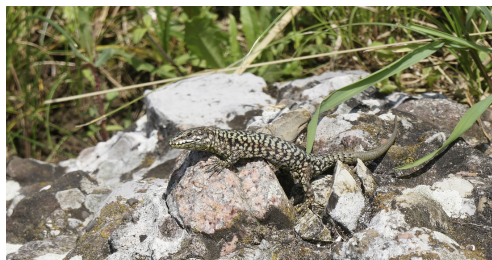
Mauereidechsen sind an schönen Tagen oft an besonnten Steinstrukturen zu erblicken.