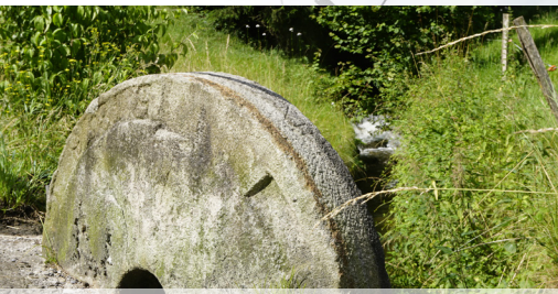
Ein alter Mühlstein ziert die Brücke über den Aahusbach in der Lochmühle.