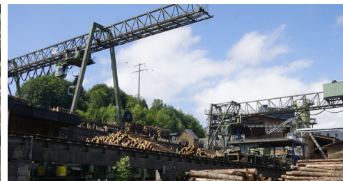
Das emsige Treiben im Sägewerk der Schilliger Holz AG ist eindrücklich zu beobachten.

Angekommen in Haltikon, lädt die St. Katharina Kapelle zur Besichtigung ein. Die 1636 erbaute Kapelle enthält eine eindrucksvolle Walmdecke aus Holz, welche 1971 restauriert wurde.