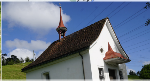
Die Rotkreuzkapelle aus dem 17. Jahrhundert wird auch Kapelle „Maria zur guten Wende“ genannt.