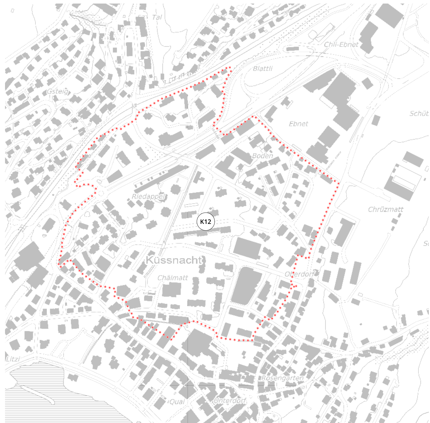
Stand 1. öffentliche Auflage