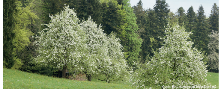
Strukturreiche Streuobstwiese mit Altholzbestand: Ein idealer Lebensraum

Die Männchen der beiden Arten lassen sich eindeutig unterscheiden.