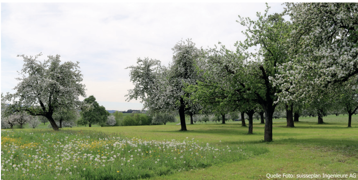
Hochstamm-Obstgärten strukturieren und bereichern unsere Landschaft.