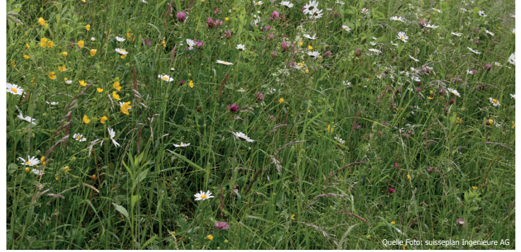
Die Zurechnungsflächen bieten Obstgartenbewohnern Nahrung und Deckung.