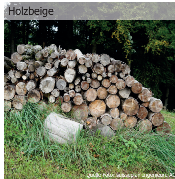
Mögliche Strukturelemente zur Aufwertung des Hochstamm-Obstgartens