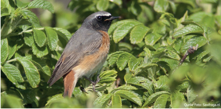
Gartenrotschwanz: Typischer, aber selten gewordener Obstgartenbewohner

Hochstamm-Feldobstbäume bieten nicht nur Vögeln, sondern auch Insekten und Kleinsäugetern geeigneten Lebensraum. Ökologisch besonders wertvoll sind zusammenhängende Bestände mit Bäumen unterschiedlichen Alters, mehreren Obstsorten und verschiedenen Unternutzungen. Ein Hochstamm-Obstgarten besteht aus mind. 10 Bäumen und einer Zurechnungsfläche (Biodiversitätsförderfläche, BFF) in einer Distanz von max. 50 m. Diese wertet den Hochstamm-Obstgarten zusätzlich auf, indem sie beispielsweise zahlreiche Insekten für den Gartenrotschwanz beherbergt, ein typischer Obstgartenbewohner.