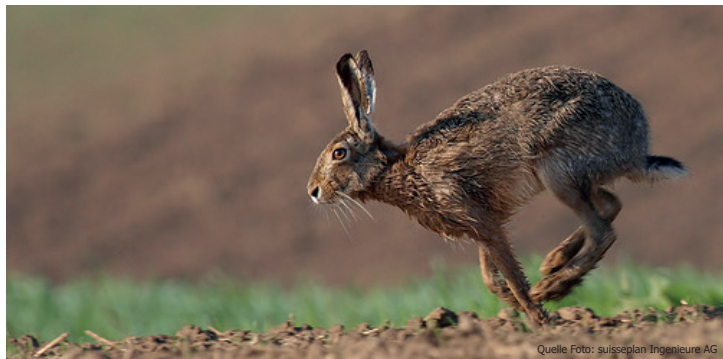
Feldhasen können auf der Flucht bis zu 70 km/h schnell werden.

Der Feldhase ist ein typischer Bewohner der Kulturlandschaft – ein sogenannter Kulturfolger. Vielerorts sind die Feldhasen heimisch, aber nur noch selten zu beobachten. Wir helfen dem Hasen, damit er nicht ganz verschwindet. Feldhasen leben in der offenen Kulturlandschaft und sind auf Strukturen wie Hecken, Krautsäume und gestufte Waldränder angewiesen. Feldhasen können fast jede Form pflanzlicher Nahrung nutzen. Für die Feldhasenförderung spielt die Landwirtschaft also eine zentrale Rolle. Der Feldhase ist ein Sympathieträger – helfen wir ihm gemeinsam auf die Sprünge!