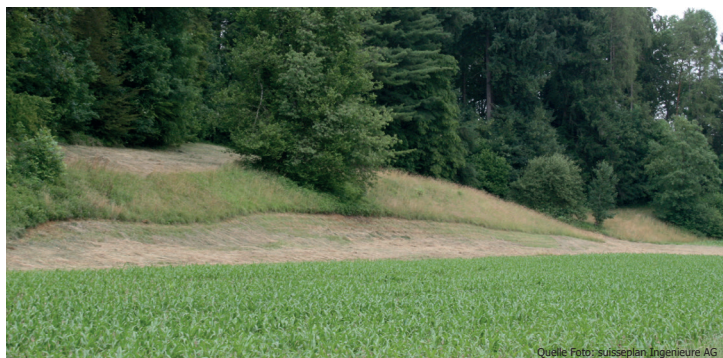
Rückzugstreifen auf gemähten Wiesen sind für Feldhasen wichtig.

Feldhasen sind scheue und störungsempfindliche Tiere. Besonders die erwachsenen Feldhasen sind ausgesprochene Fluchttiere. Dabei dienen die grossen Ohren dem frühen Entdecken von möglichen Feinden, die kräftigen Hinterbeine erlauben ein blitzschnelles Entfliehen. Normalerweise leben Feldhasen als Einzelgänger. Zur Paarungszeit versammeln sie sich zu kleinen Gruppen. Hasenfamilien sind auf einen störungsarmen Lebensraum angewiesen. Für die Junghasen sind besonders frei umherlaufende Hunde problematisch.