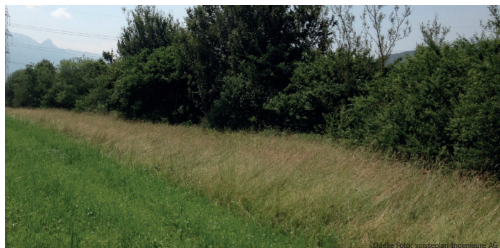
Krautsäume entlang von Hecken bieten Schutz und Nahrung.

Der Feldhase ist gefährdet und wird auf der Roten Liste geführt. Seit Jahren nehmen die Bestände ab oder bleiben auf sehr tiefem Niveau stabil. In den meisten Agrargebieten des Schweizer Mittellandes werden zwischen 0 und 7 Hasen pro Quadratkilometer gezählt. Der anhaltend negative Trend beim Feldhasen zeigt, dass die bisherigen Massnahmen nicht ausreichen, um die Hasenbestände zu erhalten und zu fördern. Der Grund für den Bestandesrückgang liegt in der hohen Sterblichkeit der Junghasen.