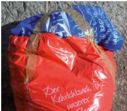
So nicht! Kehrichtsäcke müssen ordentlich zugeschnürt werden können.

Der Sack muss zugeschnürt werden können. Das Festkleben von Abfällen ist nicht gestattet. Abfälle, die nicht im Sack Platz haben, gelten als nicht bezahlt und werden unter Anordnung des Abfallverbandes ZKRI zurückgewiesen.