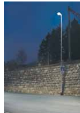
Nachher: zielgerichteter LED-Lichtstrahl