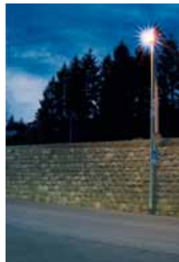
Vorher: viel unerwünschtes Streulicht

Die Broschüre «EWS-Stromsparkurs» enthält zahlreiche Ratschläge für den sparsamen Umgang mit der Energie. Zu bestellen unter Gratisnummer 0800 338 338.