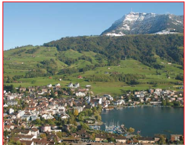
Küssnacht: Landschaftliche Schönheiten, idyllische Lage.